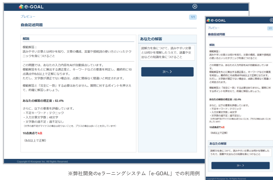
※弊社開発のeラーニングシステム「e-GOAL」での利用例